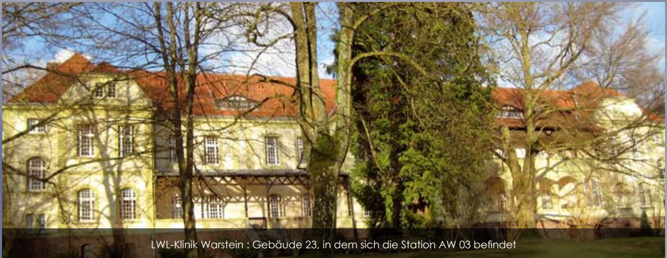
LWL-Klinik Warstein : Gebäude 23, in dem sich die Station AW 03 befindet

uns etwa in Richtung der „Psychiatrie“ oder zur „Psychiatrischen Klinik“ führte. Alles, was wir fanden, war ein Schild mit der Aufschrift „LWL-Klinik“. Weil wir keine bessere Lösung wussten, folgten wir dem Wegweiser. Als Frau Klör uns mit Ihrem Auto einholte, wussten wir, dass das Gelände, vor dem wir schließlich standen, das gesuchte war: ein riesiges Areal, parkähnlich, mit großen alten Bäumen und wunderschönen alten Häusern (so auch unser Haus, Gebäude 23, siehe Fotos). Obwohl ich keine konkrete Vorstellung im Kopf gehabt hatte, übertraf das Gesehene alle meine Erwartungen.