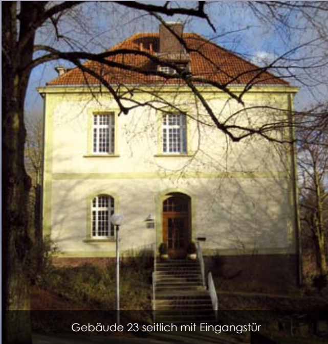
Gebäude 23 seitlich mit Eingangstür

Ich hatte schon viele Schüler von ihren Compassion-Erlebnissen berichten hören. Alle waren begeistert davon gewesen. Mein Verstand sagte mir also: „Zweifelsohne, das wird gut!“ Trotz allem war ich vor dem ersten Tag schon ein wenig kribbelig: Wie geht man mit depressiven Menschen um? Sind alle dauerhaft schlecht drauf? Sind sie vielleicht so mit sich selbst beschäftigt, dass sie mich gar nicht wahrnehmen? Wird die schlechte Stimmung auf mich übergreifen?