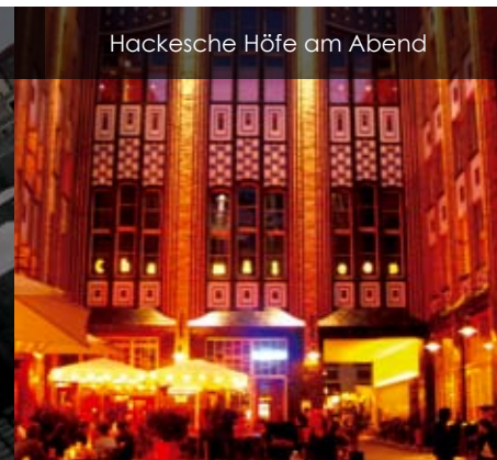
Hackesche Höfe am Abend